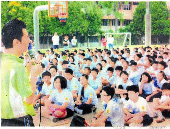
▲在课室以外，老师与学生在课外活动上拥有良好的互动。