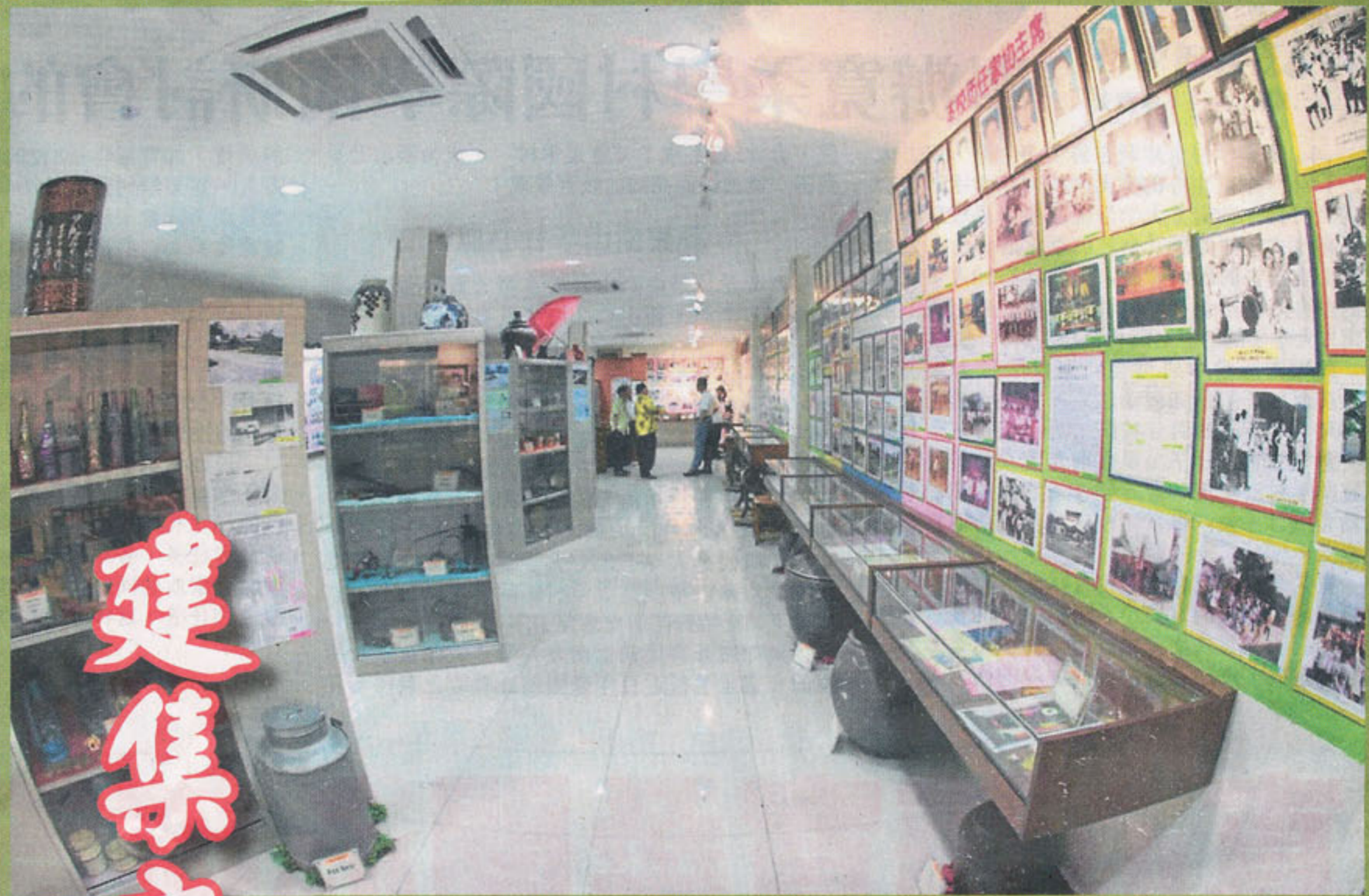
建集文史資料館耗資20萬令吉建成,它於2011年4月開幕,迄今超過一年。