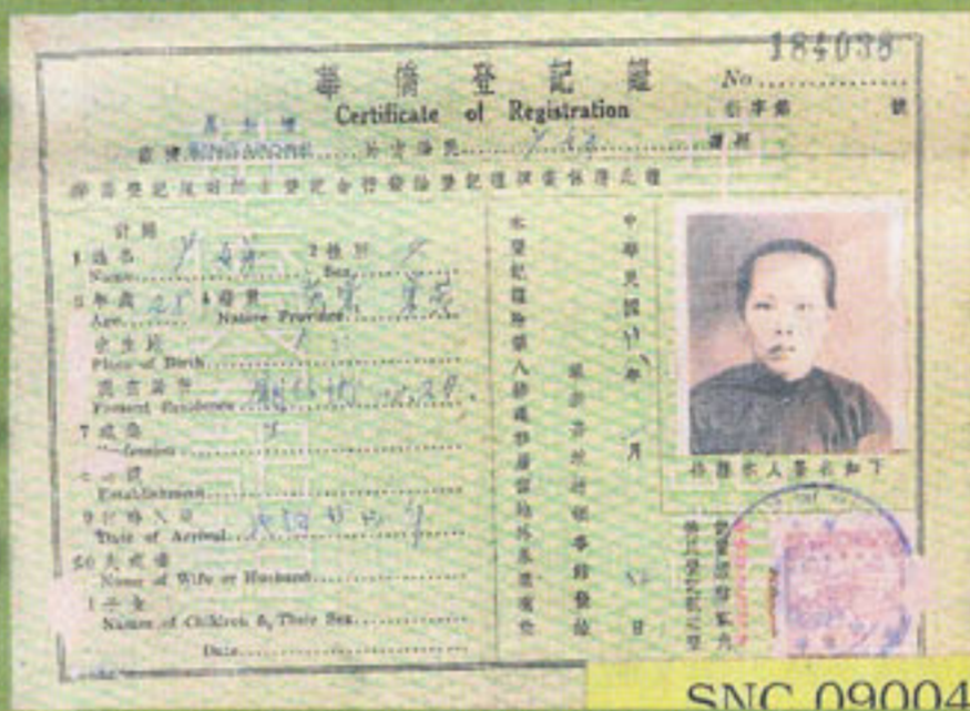
這張華僑登記證是在1939年發出。