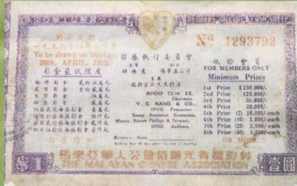
圖為1952年4月20日,馬華公會發給會員的有獎彩票。