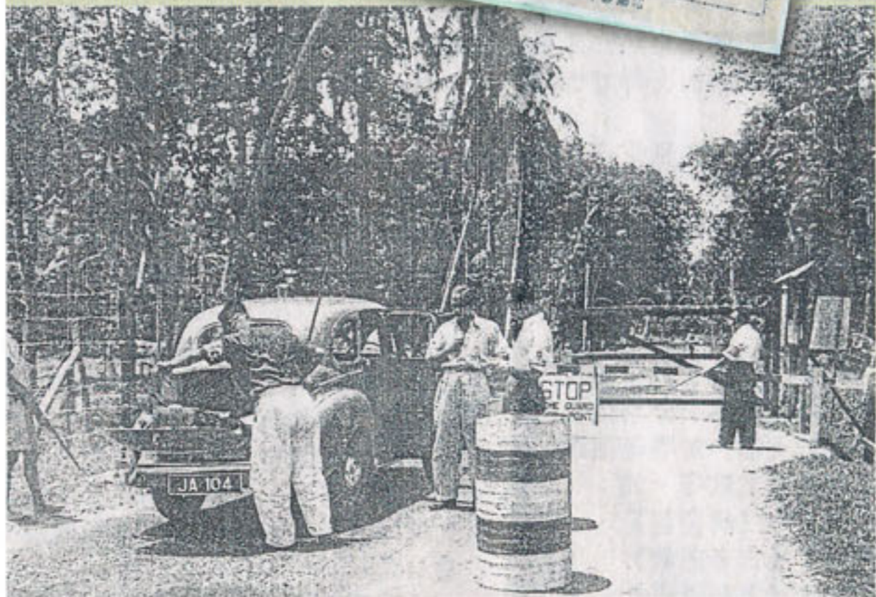
在緊急法令時期,任何出入新村者得接受軍警嚴查證件。

提前向校方來函預約參觀日期。另外,校方到了年底,也會讓已完成小六評估考試的六年級學生分批到文史館參觀。