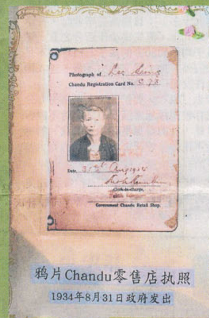
鴉片Chandu零售店執照 1934年8月31日政府發出